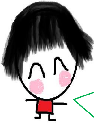
みらサポ&いばきら塾 スタッフのつぶやき

すでに私立の試験は終わり、子ども達の手元には受験結果も届いています。 進路が確定した子・次のチャンスに賭ける子、それぞれです。 その中で「合格」を手にした子の保護者から嬉しい声が届きました。 朝起きる事が出来ず（怠けではなく）学校を休みがちだったその子が、 ここに来る様になって、遅刻してでも学校に行く様になり、それが合格 にも繋がった、と喜んでいたので。新しい場所・人との関わりの中 でゆっくりと自信がついていき、それが結果に結び付いたのかも知れな い、そう考えた時、「居場所」がある事の意味を改めて思いました。 一見遠回りの様に見えても、やっぱり、安心してゆったりと過ごせる 「居場所」は必要で大切なんだ！という事。